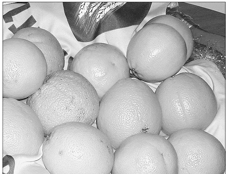
Le arance contengono antiossidanti, in grado di proteggerci dal cancro